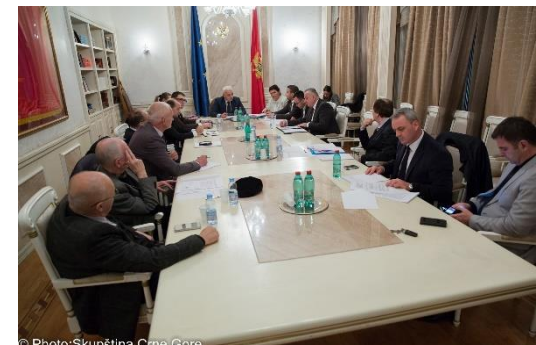
Prva sjednica Odbora za ljudska prava i slobode, 23. decembar 2016.