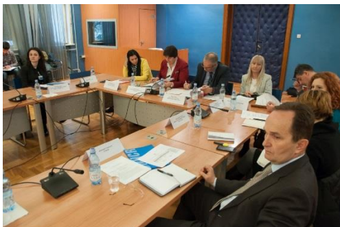
Kontrolno saslušanje Koordinatora Koordinacionog odbora za praćenje implementacije Strategije za trajno rješavanje pitanja raseljenih i interno raseljenih lica u Crnoj Gori, 61. sjednica, 29. februar 2016. godine