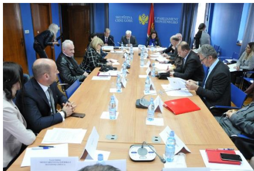
62. sjednica Odbora za ljudska prava i slobode, 21. mart 2016.