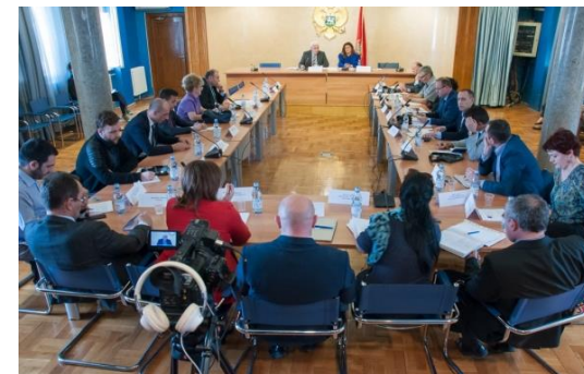
63. sjednica Odbora za ljudska prava i slobode, 13. april 2016.