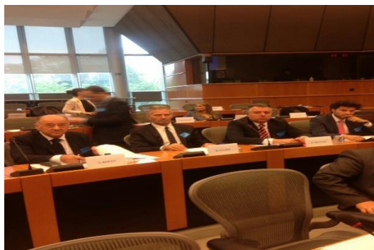
Učešće Delegacije Odbora na Interparlamentarnoj konferenciji „Imigraciona politika EU i politika azila: implikacije na parlamente zemalja proširenja“, Brisel, 20. i 21. jun 2016.